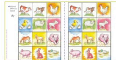
Knipvel Memory Dieren