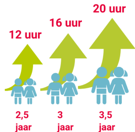
Figuur: voorbeeld invulling 16 uur VE variabel naar leeftijd

Deze handreiking is geschreven door Oberon en Sardes in opdracht van het Ministerie van OCW in het kader van het landelijke ondersteuningstraject GOAB. Het biedt gemeenten handvatten om samen met de voorschoolse aanbieders de uitbreiding van VE-uren voor te bereiden. In deze versie (van januari 2020) zijn er vier nieuwe praktijkvoorbeelden toegevoegd, zodat we een meer divers beeld schetsen van de wijze waarop gemeenten en uitvoerende partijen invulling geven aan 960 uur.